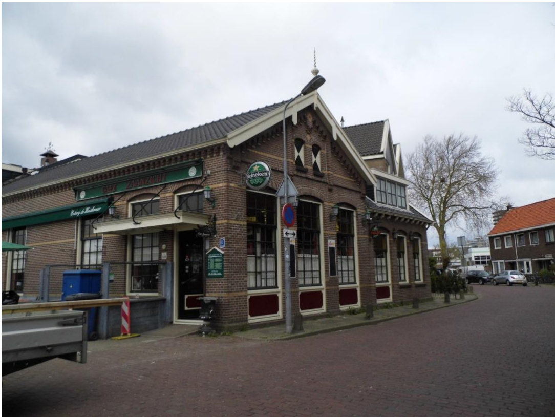
Café Zaanzicht aan de Oostzijde

Aan het eind van de Kopermolenstraat komen we bij café Zaanzicht aan de Oostzijde. In dit café hebben heel veel Zaankanters hun rijbewijs gehaald. Naast het café was de oprit van de Hoopbrug.