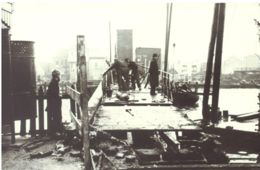
Sloop Hoopbrug in 1941.

De Hoopbrug was niet alleen erg smal voor het wegverkeer, maar was ook was de doorvaartopening te klein voor de scheepvaart. Daarom werd besloten een nieuwe brug te bouwen.