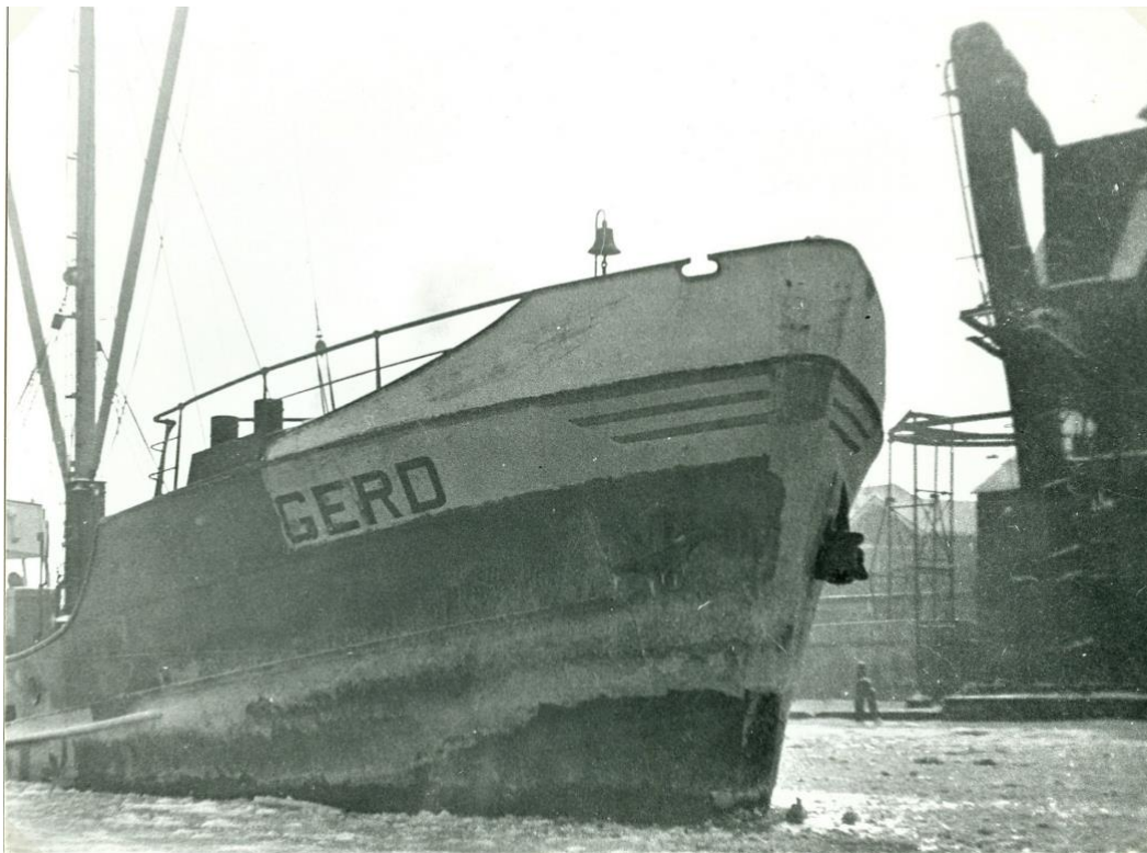
een winters plaatje februari 1956

De bedrijfsvoering leverde veel verontreinigingen op in de omgeving. De as- en sintelresten werden gebruikt voor ophoging van bouwgrond en zorgen nu nog steeds voor problemen. Uiteindelijk leverde dit voordeel op voor de atletiekvereniging. Omdat in 1960 de grond te zwaar verontreinigd was voor woningbouw, mocht er nog wel een sportveld worden aangelegd bij het nieuw te bouwen Zaanlands Lyceum.