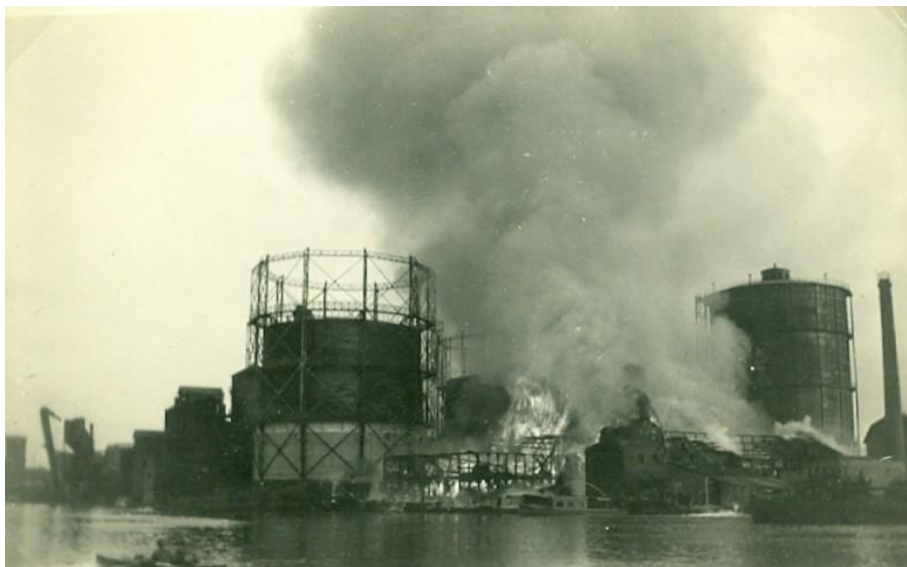
Brand in pakhuis De Zaan, 23 mei 1930

In 1951 was de verhouding tussen gasmeters en muntgasmeters nog steeds half om half. In 1930 ontstond er een zeer gevaarlijke situatie, toen in een pakhuis, dat stond op de plaats waar later de afrit van de brug kwam, een grote brand uitbrak. Met heel veel geluk en inzet van de brandweer kon voorkomen worden dat de gashouder ontplofte.