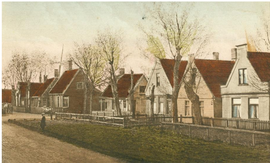
Huisjes aan het Blauwepad

In de loop van de 20 e eeuw verarmde dit buurtje snel. De sloot werd gedempt en er kwam riolering, waardoor de levensomstandigheden moesten verbeteren. Ik weet van één huis, waar in hongerwinter de vloer werd weggehaald en het hout nog voor enige verwarming zorgde. De vloer werd niet meer hersteld en de kippen en konijnen konden nu in de woonkamer bivakkeren. De bedden werden op hun hokken geplaatst.