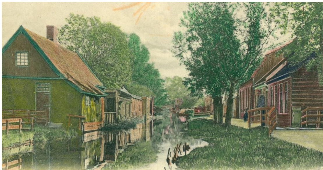
Links het Meester Cornelispad en rechts het Blauwepad

De twee paden reikten tot aan de Vaart, welke loopt langs de Jan van Goyenkade. Deze Vaart is nog steeds aanwezig.