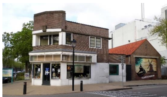
Museumwinkel Cacao de Zaan