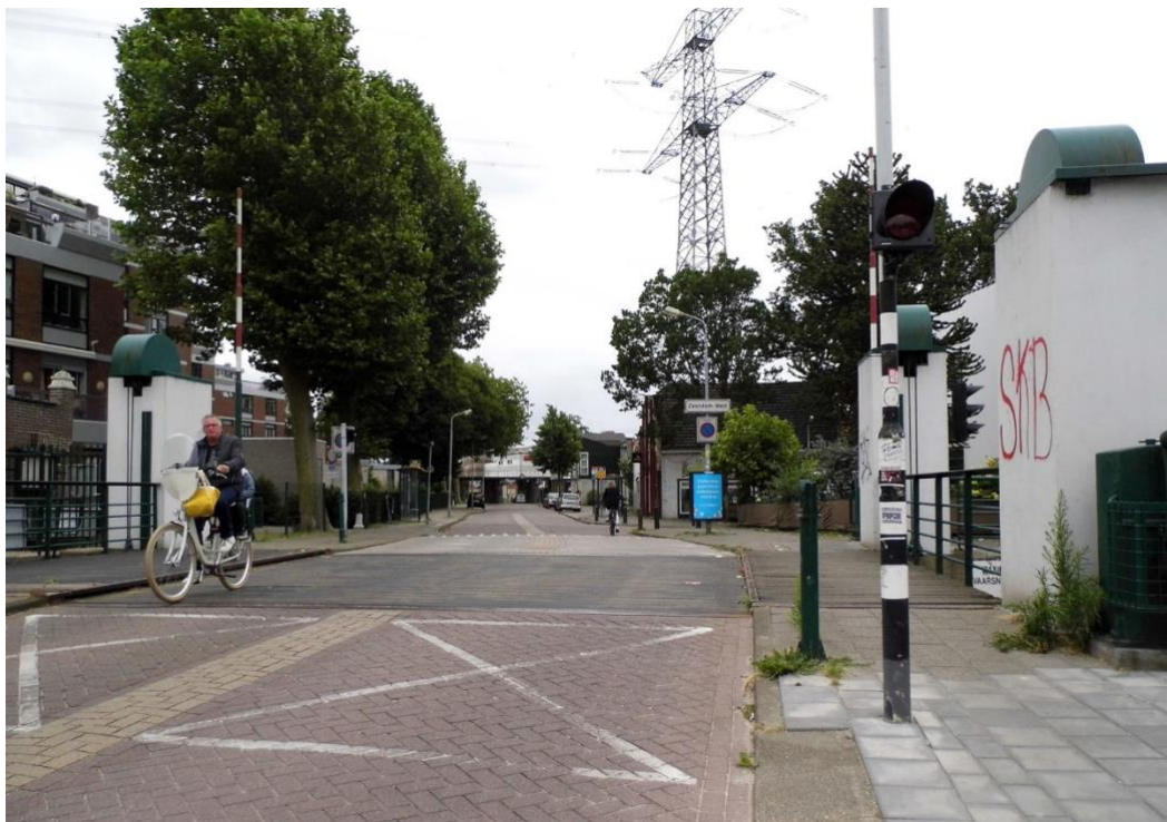
2020 Mallegatsluis op de grens met Zaandam

communisten. In de Zaansteek bleek er geen enkele zaalverhuurder bereid te zijn een ruimte voor deze bijeenkomst beschikbaar te stellen. In de cacao-fabriek van de Kamphuis & Oly mocht de organisatie wel gebruik maken van de personeelsruimte. Dit tot groot ongenoegen van de overige inwoners van de Zaanstreek. Zowel de politie van Koog aan de Zaan als van Zaandam moesten met getrokken sabel en pistool demonstranten uit elkaar houden. De cacao-fabriek in Koog aan de Zaan verbrandde een jaar later. De fabriek werd hier niet meer opgebouwd. Het bedrijf verhuisde naar Hull in Engeland, waar het tot ca. 2000 nog heeft bestaan. Op het terrein achter station Koog-Zaandijk werd de wasfabriek van Jonk gebouwd.