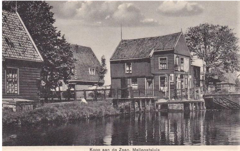
Koog aan de Zaan, Mallegatsluis

Even later bereiken we de grens van Zaandam bij de Mallegatsluis. Deze sluis vormde eeuwenlang een belangrijke doorvaart tussen de Zaan en de vele houtmolens in het Westzijderveld. Op 25 juli 1933 vond hier een treffen plaats tussen een aantal sympathisanten van de NSB en een paar honderd