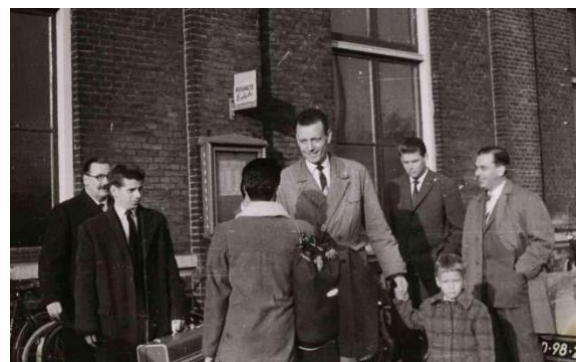
afscheid Engelse ploeg bij station Zaandam