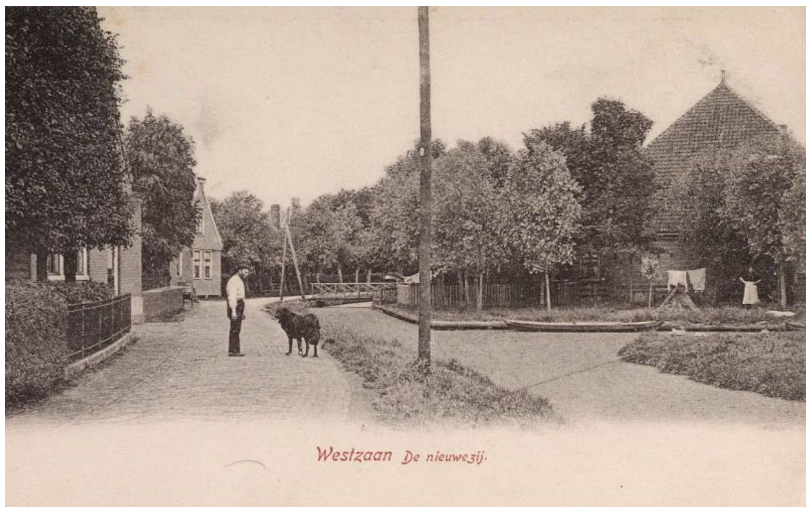
rechts boerderij Havik-Schoen