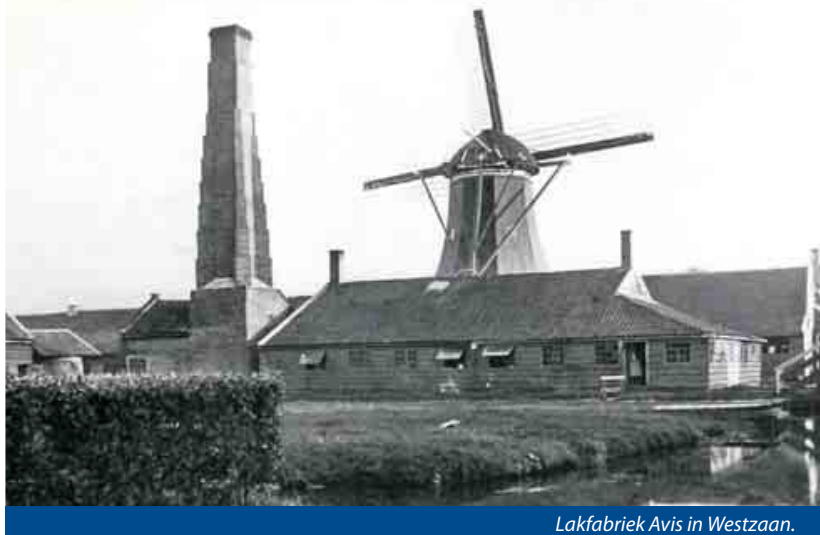
Lakfabriek Avis in Westzaan.

kracht had haar voordelen. Ze kon dag en nacht worden toegepast in grote fabrieken. Ze had ook haar beperkingen. De eerste stoommachines hadden geen groot vermogen. Ze waren bovendien niet zuinig met kolen en hadden gietijzeren onderdelen die geregeld braken. Bij storingen lag vervolgens de hele fabriek stil, totdat er een monteur was langs geweest. Het waren vooral deze gebreken die ervoor zorgden dat de stoomkracht niet meer dan aarzelend de Noordzee overstak.