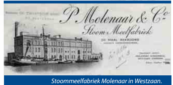
Stoommeelfabriek Molenaar in Westzaan.

Het achttiende-eeuwse Amerika viel echter nog onder de Engelse kroon. Die zag de kolonie vooral als een aantrekkelijk wingewest. Er konden, zo meende Londen, naar believen belastingen worden geheven. Al in de jaren 1770 waren de Amerikanen hiertegen in het geweer gekomen. In 1774 startte een boycot van Engelse producten. Nog geen jaar later was de oorlog met de Engelse bezettingstroepen een feit en weer een jaar later, in de zomer van 1776 zag de Onafhankelijkheidsverklaring het licht. In 1783 zou de strijd voor de Amerikanen met succes worden beëindigd.